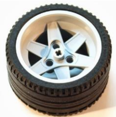
- 68.8 x 36

Оба типа колес должны быть использованы в гонке, последовательность установки колес любая.