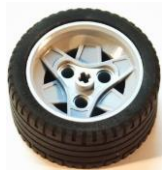
- 56 x 28